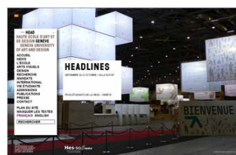
> OPTIONS B1 & B2