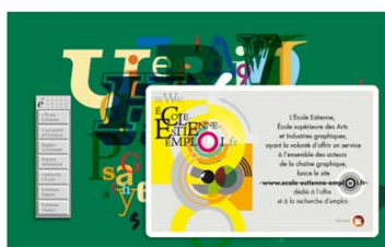
> OPTION A