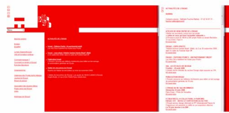
> OPTION C